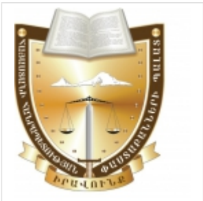
29.10.2013 ԱԿՈՒՄԲԻ ՆԻՍԻՑԻ ՀՐԱՎԵՐ