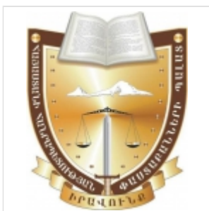
29.06.2016 ՄԱՐԶԱՅԻՆ ՀԱՄԱԿԱՐԳՈՂՆԵՐԻ ԵՎ