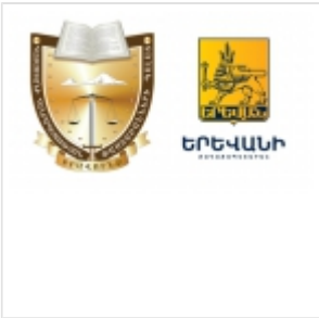
12.02.2019 ԵՐԵՎԱՆԻ ՔԱՂԱՔԱՊԵՏԱՐԱՆՆ ԱՐՁԱԳԱՆՔԵԼ Է ՓԱՍՏԱԲԱՆՆԵՐԻ ՊԱԼԱՏԻ ՆԱԽԱԳԱՀԻ ԳՐՈՒԹՅԱՆԸ