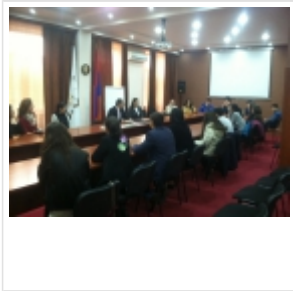
30.10.2015ԱՆԱՆԻԱ ՇԻՐԱԿԱՑԻ ՎԱՐԺԱՐԱՆԻ ԱՇԱԿԵՐՏՆԵՐԸ ՀՅՈՒՐԸՆԿԱԼՎԵԼ ԵՆ ՓԱՍՏԱԲԱՆՆԵՐԻ ՊԱԼԱՏՈՒՄ

Վերադառնալ $(window).load(function(){ if(typeof $(".fb_comments_count").html() != "undefined" && parseInt($(".fb_comments_count").html()) != 0){ updateCommentsCount(window.location.href); } })