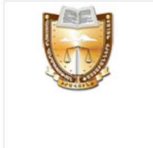
21.07.2017 ՀՀ ՓԱՍՏԱԲԱՆՆԵՐԻ ՊԱԼԱՏԻ ԽՈՐՀՈՒՐԴԸ ՓԱՍՏԱԲԱՆՆԵՐԻ ԻՐԱՎՈՒՆՔՆԵՐԻ ՊԱՇՏՊԱՆՈՒԹՅԱՆ ՀԱՐՑԻ ՎԵՐԱԲԵՐՅԱԼ ԿԱՅԱՅՐԵԼ Է ՈՐՈՇՈՒՄ