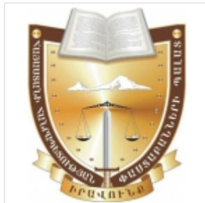
09.09.2016 THE LIST OF ADVOCATES OF SYUNIK REGION: CONCERNING THE ELECTIONS OF THE REGIONAL COORDINATOR IN SYUNIK REGION FROM THE 17-TH OF SEPTEMBER 2016