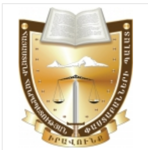
23.10.2013 «ՓԱՍՏԱԲԱՆԻ ՕՐ»