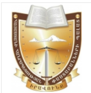
18.04.2015 «ՓԱՍՏԱԲԱՆԻ ՕՐ» ՍԱՀՄԱՆԵԼՈՒ ՀԱՐՑԸ ՔՆՆԱՐԿԵԼՈՒ ՄԱՍԻՆ»