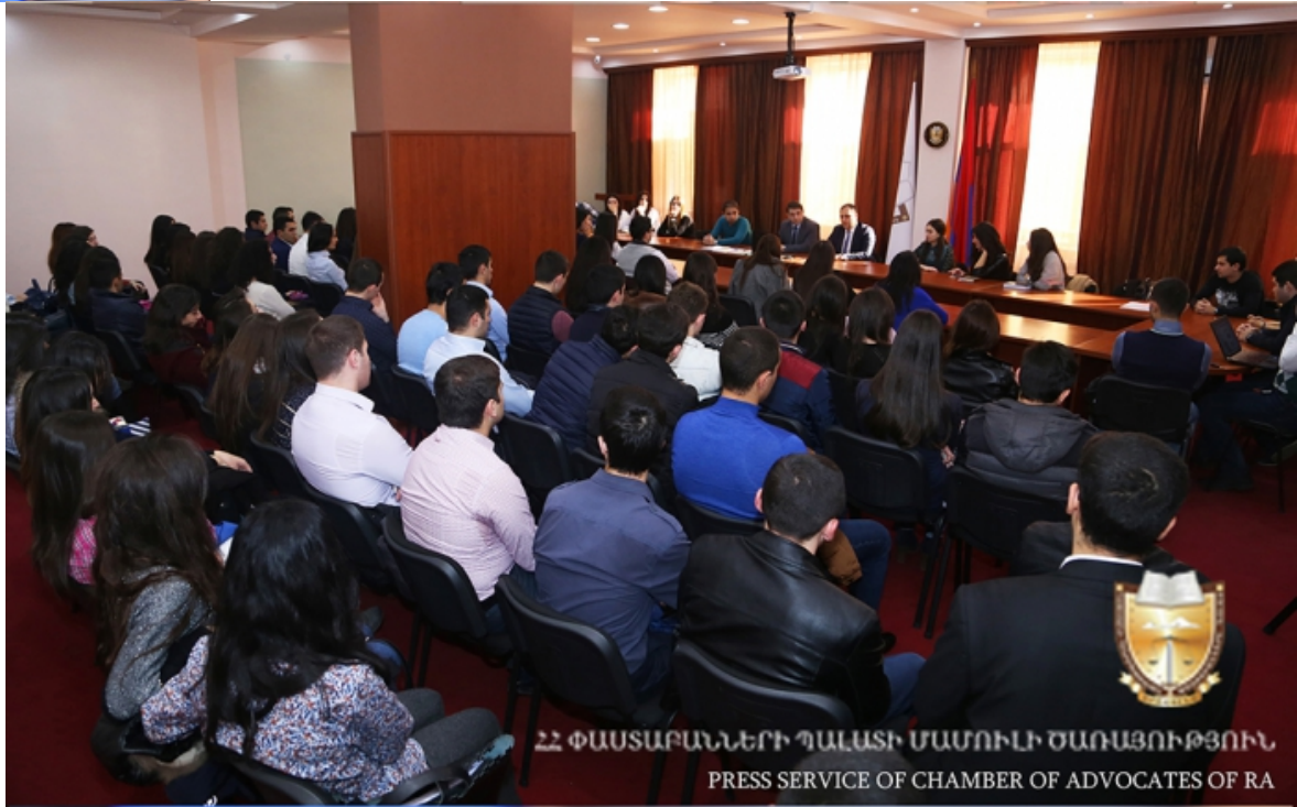
ՀՀ ՓԱՍՏԱԲԱՆՆԵՐԻ ՊԱԼԱՏԻ ՄԱՍՈՒԼԻ ԾԱՌԱՅՈՒԹՅՈՒՆ PRESS SERVICE OF CHAMBER OF ADVOCATES OF RA