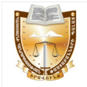
29.10.2014 STATEMENT REGARDING RA LAW PROJECT ON IMPLEMENTING AMENDMENTS AND ADDITIONS IN RA LAW ON TEMPORARY DISABILITY BENEFITS