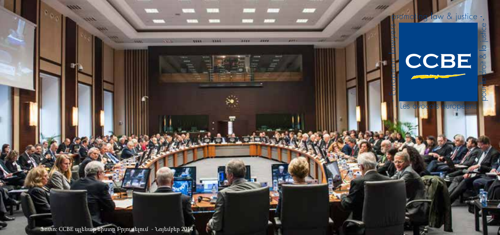
Ֆոտո: CCBE պլենար նիստը Բրյուսելում - Նոյեմբեր 2014