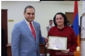
ՀԱՅԱՍՏԱՆԻ ՊԱԼԱՏԻ ՄԱՍԻՆԻՍՏՆԵՐԻ ՓԱԿԱՆՈՒԹՅՈՒՆ PRESS SERVICE OF CHAMBER OF ADVOCATES OF RA