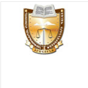
17.09.2013 ՍԵՊՏԵՄԲԵՐ ԱՄՍՎԱ ՎԵՐԱՊԱՏՐԱՍՏՄԱՆ ԴԱՍԸՆԹԱՑՆԵՐ