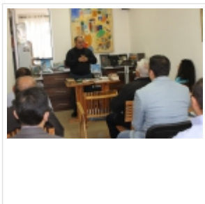
09.10.2013 ԱՎԱՐՏՎԵՑ «ՍՏՐԱՏԵԳԻԱՅԻ ԱՐՎԵՍԸ» ԹԵՄԱՅՈՎ ՎԵՐԱՊԱՏՐԱՍՏՄԱՆ ԴԱՍԸՆԹԱՑԸ