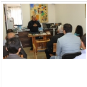
09.10.2013 ԱՎԱՐՏՎԵՑ «ՍՏՐԱՏԵԳԻԱՅԻ ԱՐՎԵՍԸ» ԹԵՄԱՅՈՎ ՎԵՐԱՊԱՏՐԱՍՏՄԱՆ ԴԱՍԸՆԹԱՑԸ