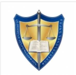
30.09.2013 ԴԱՍԸՆԹԱՑՆԵՐԻ ՓՈՓՈԽՈՒԹՅՈՒՆ