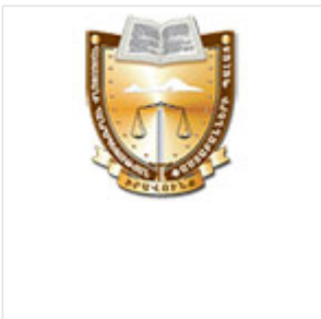
17.09.2013 ՍԵՊՏԵՄԲԵՐ ԱՄՍՎԱ ՎԵՐԱՊԱՏՐԱՍՏՄԱՆ ԴԱՍԸՆԹԱՑՆԵՐ