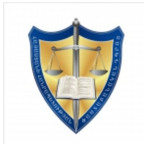
30.09.2013 «ՍՏՐԱՏԵԳԻԱՅԻ ԱՐՎԵՍԸ» ԹԵՄԱՅՈՎ ԴԱՍԱԽՈՍՈՒԹՅՈՒՆ