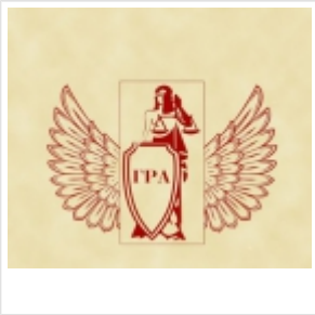
25.10.2013 ՌՈՒՍԱՍՏԱՆԻ ՓԱՍՏԱԲԱՆՆԵՐԻ ԳԻԼԴԻԱՅԻ ՆԱԽԱԳԱՀԻ ԳՐՈՒԹՅՈՒՆԸ՝ ՀՀ ՓԱՍՏԱԲԱՆՆԵՐԻ ՊԱԼԱՏԻ ՆԱԽԱԳԱՀԻՆ