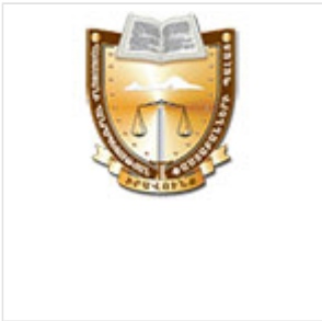
17.09.2013 ՍԵՊՏԵՄԲԵՐ ԱՄՍՎԱ ՎԵՐԱՊԱՏՐԱՍՏՄԱՆ ԴԱՍԸՆԹԱՑՆԵՐ