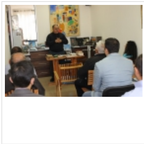
09.10.2013 ԱՎԱՐՏՎԵՑ «ՍՏՐԱՏԵԳԻԱՅԻ ԱՐՎԵՍԱԸ» ԹԵՄԱՅՈՎ ՎԵՐԱՊԱՏՐԱՍՏՄԱՆ ԴԱՍԸՆԹԱՑԸ