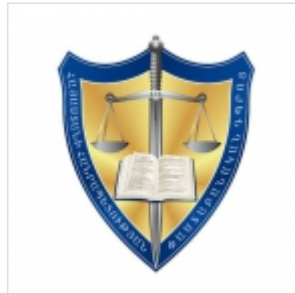
30.09.2013 «ՍՏՐԱՏԵԳԻԱՅԻ ԱՐՎԵՍԱԸ» ԹԵՄԱՅՈՎ ԴԱՍԱԽՈՍՈՒԹՅՈՒՆ