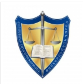
30.09.2013 ԴԱՍԸՆԹԱՑՆԵՐԻ ՓՈՓՈԽՈՒԹՅՈՒՆ