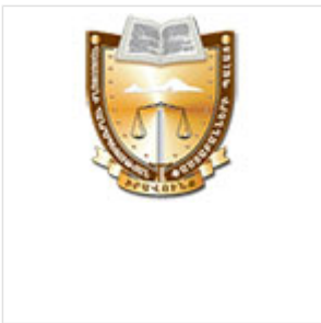
17.09.2013 ՍԵՊՏԵՄԲԵՐ ԱՄՍՎԱ ՎԵՐԱՊԱՏՐԱՍՏՄԱՆ ԴԱՍԸՆԹԱՑՆԵՐ