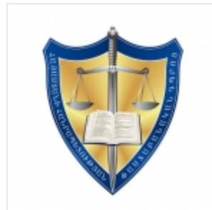
30.09.2013 «ՍՏՐԱՏԵԳԻԱՅԻ ԱՐՎԵՍԸ» ԹԵՄԱՅՈՎ ԴԱՍԱԽՈՍՈՒԹՅՈՒՆ