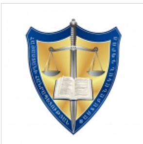
30.09.2013 ԴԱՍԸՆԹԱՑՆԵՐԻ ՓՈՓՈԽՈՒԹՅՈՒՆ