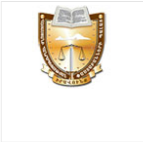
17.09.2013 ՍԵՊՏԵՄԲԵՐ ԱՄՍԿԱ ՎԵՐԱՊԱՏՐԱՍՏՄԱՆ ԴԱՍԸՆԹԱՑՆԵՐ