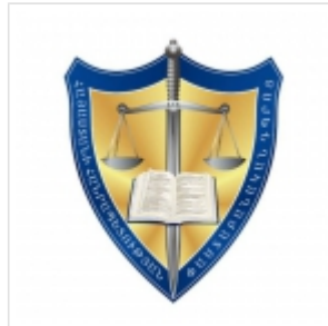
30.09.2013 «ՍՏՐԱՏԵԳԻԱՅԻ ԱՐՎԵՍԸ» ԹԵՄԱՅՈՎ ԴԱՍԱԽՈՍՈՒԹՅՈՒՆ