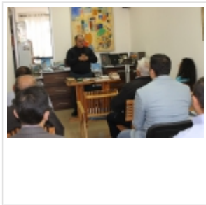
09.10.2013 ԱՎԱՐՏՎԵՑ «ՍՏՐԱՏԵԳԻԱՅԻ ԱՐՎԵՍԸ» ԹԵՄԱՅՈՎ ՎԵՐԱՊԱՏՐԱՍՏՄԱՆ ԴԱՍԸՆԹԱՑԸ