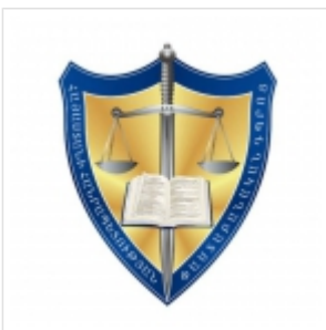
30.09.2013 ԴԱՍԸՆԹԱՑՆԵՐԻ ՓՈՓՈԽՈՒԹՅՈՒՆ