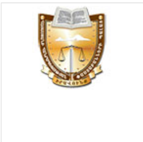
17.09.2013 ՍԵՊՏԵՄԲԵՐ ԱՄՍՎԱ ՎԵՐԱՊԱՏՐԱՍՄԱՆ ԴԱՍԸՆԹԱՑՆԵՐ