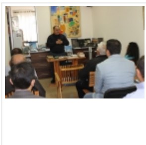
09.10.2013 ԱՎԱՐՏՎԵՑ «ՍՏՐԱՏԵԳԻԱՅԻ ԱՐՎԵՍԸ» ԹԵՄԱՅՈՎ ՎԵՐԱՊԱՏՐԱՍՄԱՆ ԴԱՍԸՆԹԱՑԸ