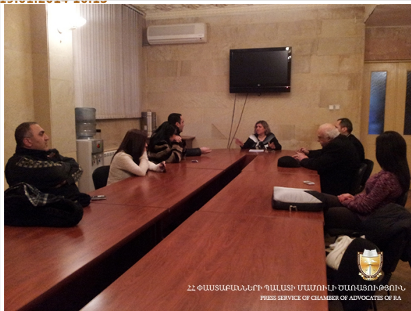
ՀՀ ՓԱՍՏԱԲԱՆՆԵՐԻ ՊԱՍՏԻՄԱՍՏՈՒԿ ԾԱՌԱՅՈՒԹՅՈՒՆ PRESS SERVICE OF CHAMBER OF ADVOCATES OF RA