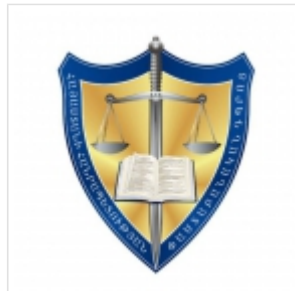
30.09.2013 «ՍՏՐԱՏԵԳԻԱՅԻ ԱՐՎԵՍԸ» ԹԵՄԱՅՈՎ ԴԱՍԱԽՈՍՈՒԹՅՈՒՆ