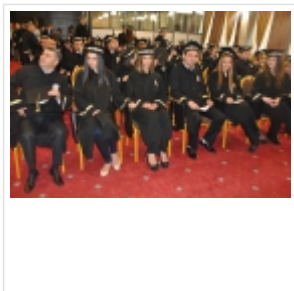
06.10.2013 ՓԱՍՏԱԲԱՆԱԿԱՆ ՀԱՄԱՅՆՔԸ ՀԱՄԱԼՐՎԵՑ ՆՈՐ ՓԱՍՏԱԲԱՆՆԵՐՈՎ