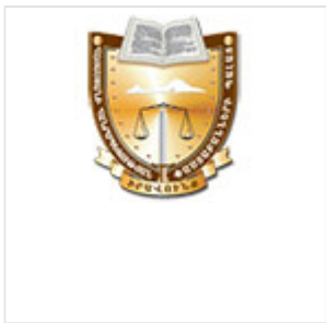
21.11.2014 ՀՀ ՓԱՍՏԱԲԱՆՆԵՐԻ ՊԱԼԱՏԻ ԽՈՐՀՈՒՐԴԸ ՀԱՄԱԼՐՎԵԼ Է ՆՈՐ ԱՆԴԱՄՆԵՐՈՎ