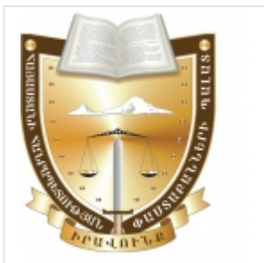
18.10.2013 ՀՀ ՓՊ ՆԱԽԱԳԱՀԻ 17.10.2013Թ