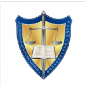
30.09.2013 ԴԱՍԸՆԹԱՑՆԵՐԻ ՓՈՓՈԽՈՒԹՅՈՒՆ