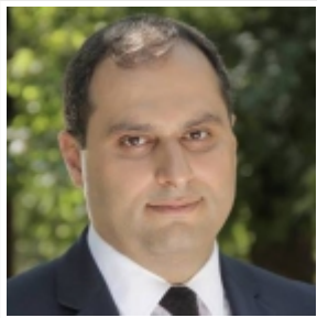
16.10.2013 ՀԱՆԴԻՊՈՒՄ ԱՐԴԱՐԱԴԱՏՈՒԹՅԱՆ ՆԱԽԱՐԱՐԻ ՀԵՏ