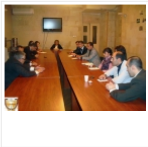
22.11.2013 ՓԱՍՏԱԲԱՆՆԵՐԻ ՊԱԼԱՏԻ ԱՎՈՒՄՐՈՒՄ ՔՆՆԱՐԿՎԵԼ Է ՓԱՍՏԱԲԱՆԱԿԱՆ ԳՈՐԾՈՒՆԵՈՒԹՅԱՆ ԻՐԱԿԱՆԱՑՄԱՆ ԱՌԱՆՁՆԱՀԱՏՎՈՒԹՅՈՒՆՆ ԵՐԸ