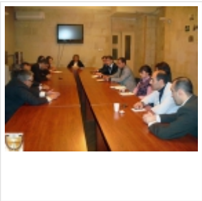
26.11.2013 ՔՐԵԱԿԱՆ ԴԱՏԱՎԱՐՈՒԹՅԱՆ ՄԱՍԻՆ ՕՐԵՆԱԳՐԻ ՆԱԽԱԳԾՈՒՄ ԱՌԿԱ ԵՆ ԱՅՆՊԻՍԻ ՀԱՏՎԱՆԻՇՆԵՐ, ՈՐՈՒՔ ՎՏԱՆԳԵԼՈՒ ԵՆ ՄԵՂԱԴՐՅԱԼԻ ՀԻՄՆԱՐԱՐ ԻՐԱՎՈՒՆՔՆԵՐԻ Լ