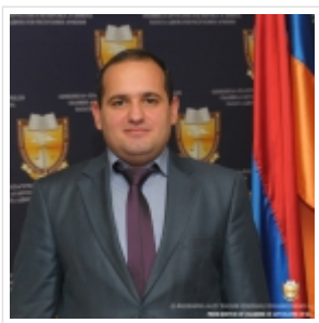
08.05.2015 ՀԱՅ ՓԱՍՏԱԲԱՆԸ ՆՇԱՆԱԿՎԵԼ Է ՓԱՍՏԱԲԱՆՆԵՐԻ ՄԻՋԱԶԳԱՅԻՆ ՄԻՈՒԹՅԱՆ ՆԱԽԱԳԱՀԻ ԽՈՐՀՐԴԱԿԱՆ